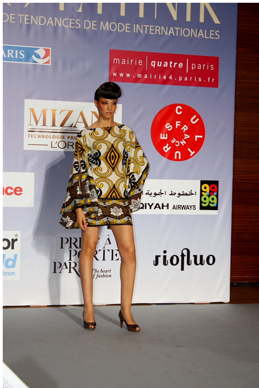
Défilé Ki2 Fashion